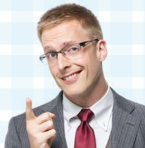
厚切りジェイソン 氏